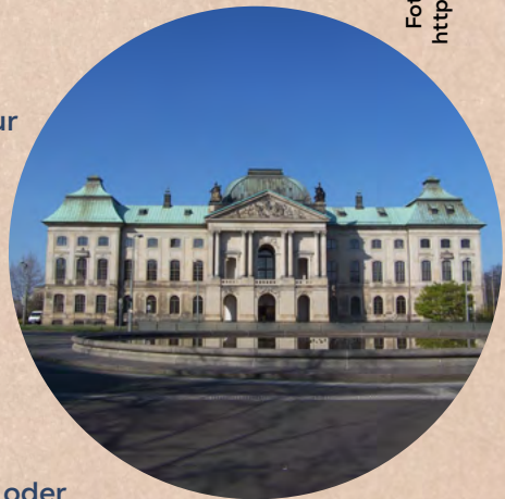
Japanisches Palais Dresden

Ob Wochenendausflug für's ganze Team oder große Party mit Freund*innen: Was ihr mit dem Geld macht, bleibt natürlich euch überlassen.